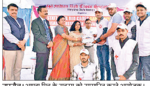
नारनौल। आपदा मित्र के सदस्य को सम्मानित करते आयोजक।

आपदा के समय फंसे लोगों तक सहायता पहुंचाकर उनकी जान बचाने के उद्देश्य से भारतीय रेडक्रॉस सोसायटी हरियाणा राज्य शाखा चंडीगढ़ की ओर से प्रशिक्षित आपदा मित्र बनाने की योजना शुरू की गई है। इसके तहत युवाओं को आपदा में सहायता के लिए ट्रेनिंग दी जा रही है। इसमें जिले के आठ स्वयंसेवकों को आपदा मित्र बनाया