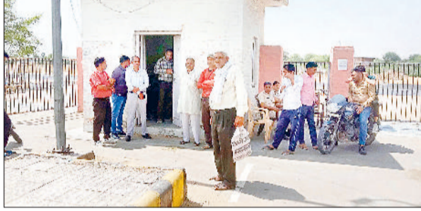
नारनौल। गेट पास कटवाने के इंतजार में मंडी गेट पर खड़े किसान व मंडी में खड़ी सरसों से भरी पिकअप गाड़ियां।

जिले में बुधवार को भी समर्थन मूल्य पर सरसों की खरीद शुरू नहीं हो पाई। हालांकि अनाज मंडी में सरसों लेकर पहुंचे किसानों को मार्केट कमेटी की ओर से गेट पास जरूर जारी किए गए, लेकिन यह कार्य में दोपहर करीब 12 बजे शुरू किया गया। जिसके कारण मंडी में सरसों लेकर किसानों को काफी परेशानी उठानी पड़ी। बता दें कि सरकार ने 26 मार्च से समर्थन मूल्य पर सरसों खरीद शुरू करने की घोषणा की थी, लेकिन पोर्टल अपडेट नहीं होने के कारण गेट पास नहीं कटने पर खरीद शुरू नहीं हो पाई। वहीं दूसरे दिन बुधवार को भी सरसों की खरीद शुरू नहीं की गई। जिसका कारण सरसों में नमी की मात्रा ज्यादा होना व पुरानी सरसों रहा। जिसके चलते मंडी में सरसों लेकर पहुंचे किसानों को वापस लौटना पड़ा था। सरकार की ओर से इस वर्ष सरसों का समर्थन मूल्य 5650, गेहूँ का 2275, जौ का 1850 व चना 5450 रुपये एमएसपी की दर से खरीदा जाएगा। जिसके लिए किसानों की ओर से मेरी फसल मेरा ब्यूरो पोर्टल पर फसल का पंजीकरण अनिवार्य है, जिस भी किसान ने पोर्टल पर पंजीकरण नहीं