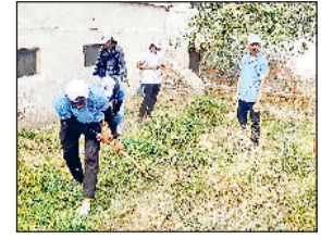
नारनौल। सफाई करते स्वयंसेवक।