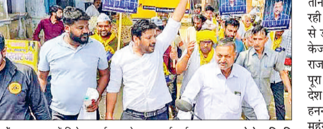
महेंद्रगढ़। शहर में विरोध प्रदर्शन करते आप कार्यकर्ता।