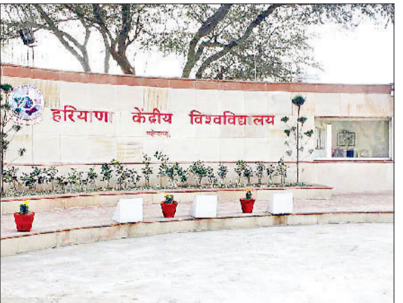
महेन्द्रगढ़। हरियाणा केंद्रीय विश्वविद्यालय का भवन।

के लिए सराहना की। उन्होंने कहा कि विश्वविद्यालय नेशनल सोलर मिशन (एनएसएम) और नेशनल मिशन फॉर ग्रीन इंडिया (जीआईएम) सहित जलवायु परिवर्तन पर केंद्रित भारत की राष्ट्रीय कार्य योजना पर शोध व