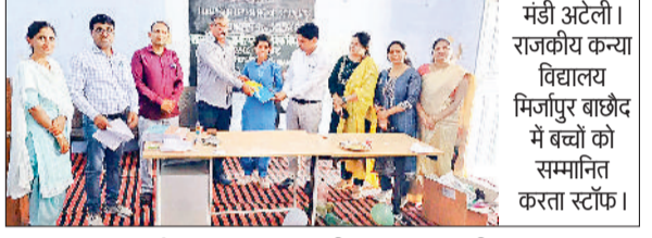
मंडी अटेली। राजकीय कन्या विद्यालय मिर्जापुर बाछौद में बच्चों को सम्मानित करता स्टॉफ।